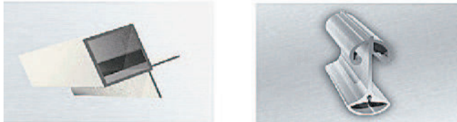
Профиль для изготовления вентиляционного оборудования