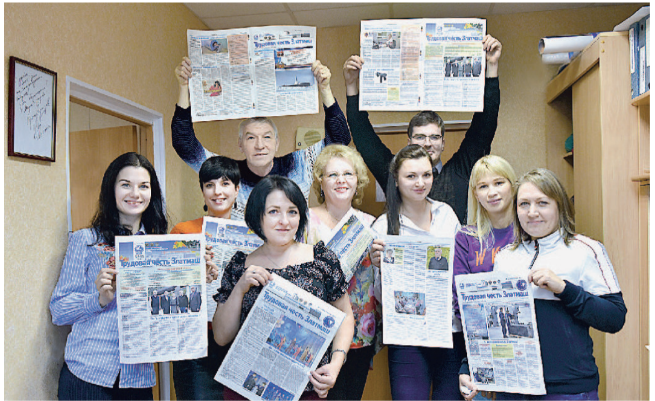
Победа в конкурсе – радость общая! Коллектив отдела № 505.